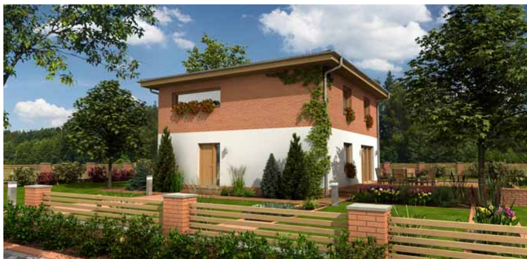
obr. 3 – Rodinný dům GS PASIV 2, str. 58

potenciálu. Rozhodně, pokud má mít naše zahrada nějaký „genius loci“, bude se jednat o „běh na dlouhou trať“. Na rozdíl od domu, který se postaví a ihned nás osloví, je zahrada velmi výrazně ovlivněna během času a do své krásy