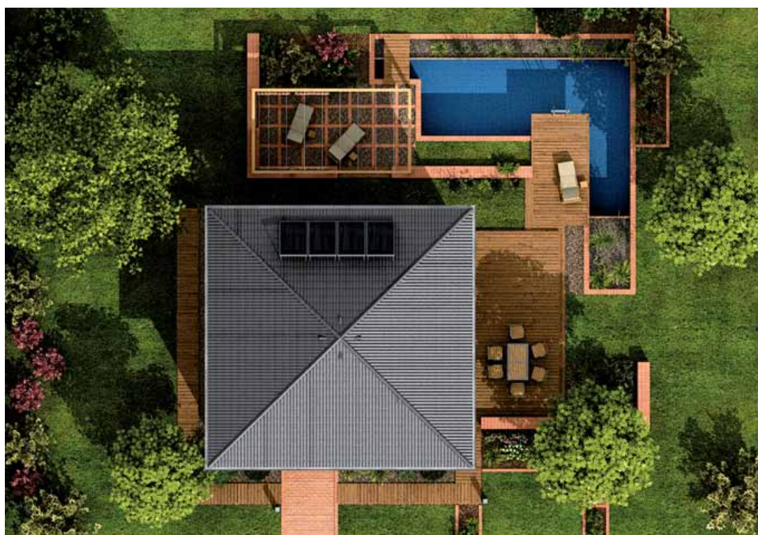
obr. 4 – Rodinný dům GS PASIV 2, str. 58

spíše postupně zraje. Založený základ zahrady je ale hotový a funkční při pečlivě připravených podkladech poměrně rychle a dělá svému majiteli radost již od prvních chvil, kdy ještě rostliny většinou nehrají tu hlavní roli.