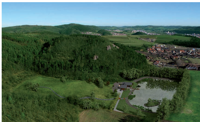
Fotorealistická vizualizace terénu se srubem z obrázků nahoře

Více na www.navrhy-zahrad.com , www.vizualizace.cz . □