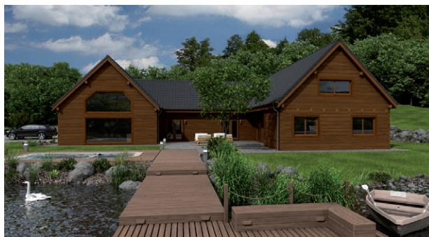
Ukázka architektonického řešení velkého pozemku se srubem, návrhem rybníku a okolí srubu

nad více variantami řešení, aniž by bylo potřeba cokoli budovat.