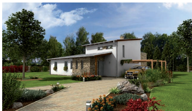
Od studie až po fotorealistického zobrazení typového domu INTEGRA PLUS z katalogu firmy G SERVIS CZ s.r.o.